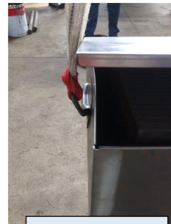
吊り上げ時の状態